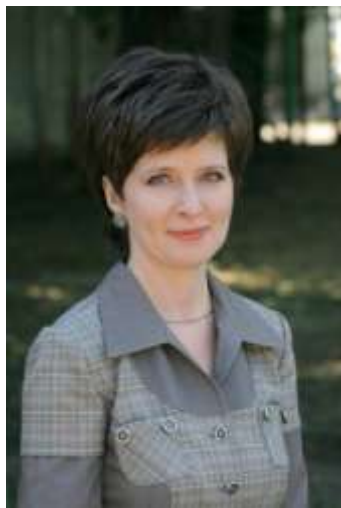
Директор ЦТР и ГО «Искорка»